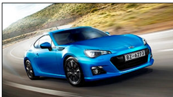
SUBARU BRZ (中国仕様車)

プレスブリーフィングは、4月20日(土) 10:30(現地時間)からスバルブースにて行う予定です。