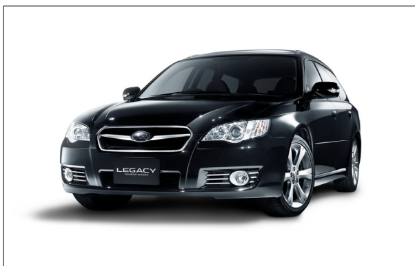
スバル レガシィ ツーリングワゴン 「3.0R SI-Cruise Limited」

そのほか、アクセスキーの携帯により、ドアの施錠・開錠とプッシュスイッチによるエンジン始動を可能としたキーレスアクセス&プッシュスタート機能、運転席8ウェイパワーシートのメモリー機能や助手席パワーシートなど専用の上級装備を充実させ商品力を高めている。