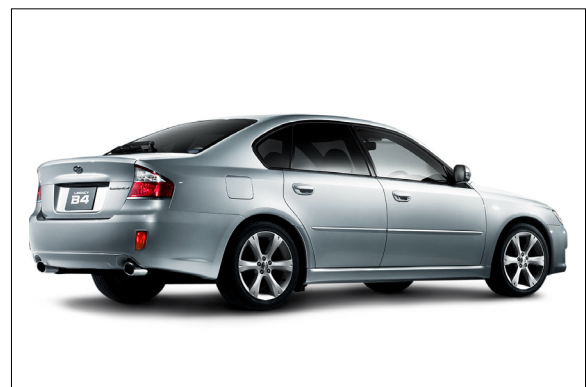
スバル レガシィ B4 「2.0GT SI-Cruise Limited」